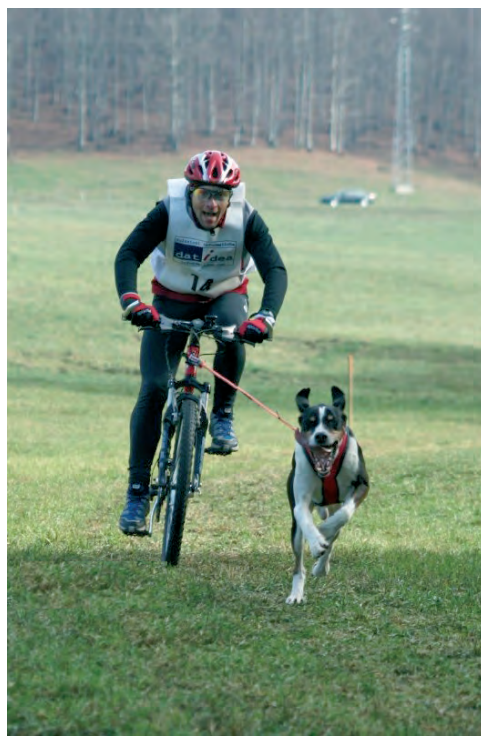
L'atleta cassoiese in una foto inedita scattata a Conco qualche anno fa, durante una gara di campionato con il suo Charlie